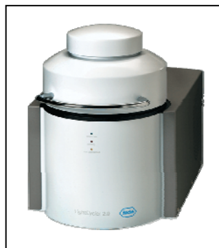
移动式 LightCycler 主机系统